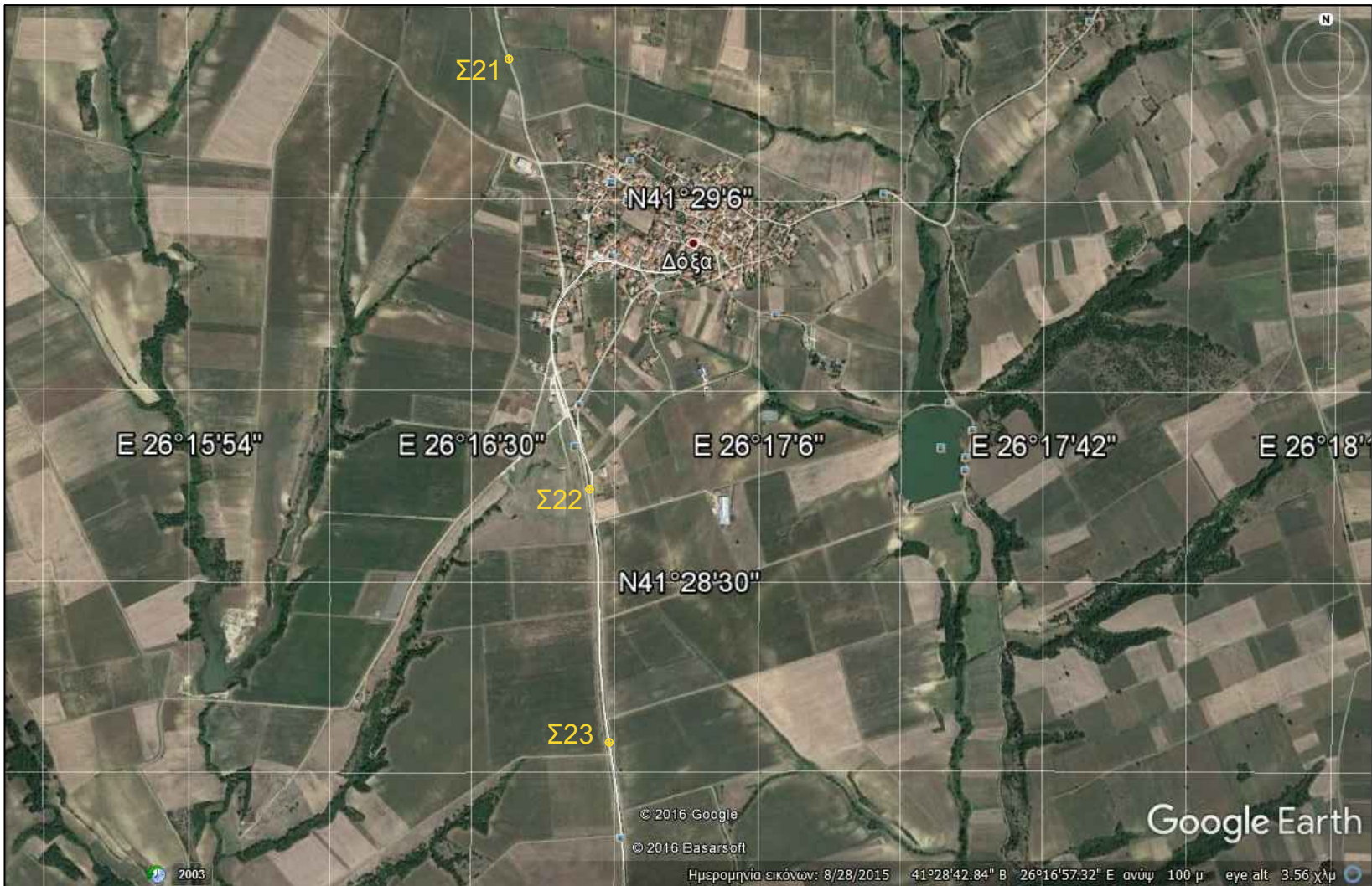
Δόξα - Επαρχιακός